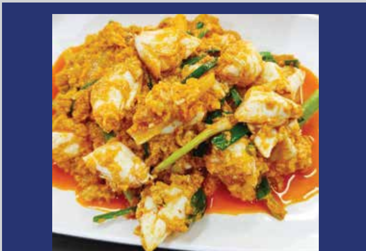
Squid/Soft Shell Crab/Crab Claws 420.-/480.-/560.- Stir-fried with Curry Powder Stir-fried in scrumptious curry powder to perfection to accentuate its piquant flavors and mouthwatering aroma.

ปลากรอบพัดเม็ดมะม่วงหิมพานต์ ความอร่อยครบรสและลงตัวของปลากรอบและ เม็ดมะม่วงหิมพานต์ พริกแห้งบางช้าง พัดไฟแดงด้วยเหล้าจีนหอมอร่อย