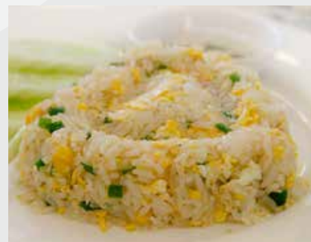
Egg Fries Rice