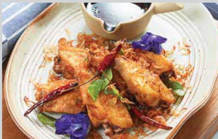
Chicken Wings Deep-Fried with Kaffir Lime Leaves 260.- Seasoned chicken wings are deep-fried twice using different temperatures and durations for extra crunchiness, accentuated with fried lemongrass and kaffir lime leaves, and served with a dipping sauce to heighten the delectability.

ไก่เสต๊ะ (4 ไม้) เนื้อสันในไก่หมักนุ่มเครื่องเทศรสชาติเข้มข้น อย่างเต่าถ่านให้หอม เสิร์ฟคู่กับน้ำจิ้มโฮมเมด