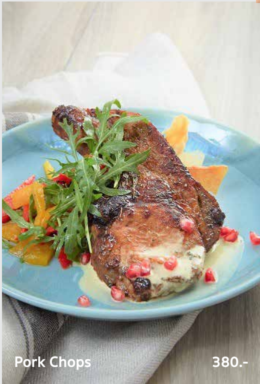
Pork Chops 380.-

สเต็กเนื้อริบอาย เนื้อวัวออสเตรเลียที่มีอายุ 100วัน ส่วนซี่โครง ไม่ติดกระดูกมีมันแทรกเล็กน้อยย่างเตาถ่านไฟ แรง กับเกลือฮิมาลายัน พริกไทยดำ ทาด้วย เนยสูตรพิเศษ เสิร์ฟกับถั่วลันเตาหวานย่าง และมันบด