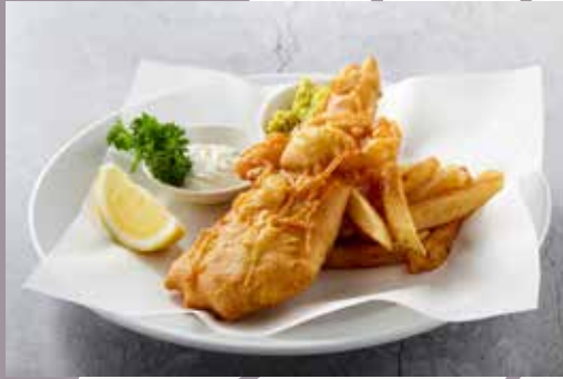
Fish & Chips