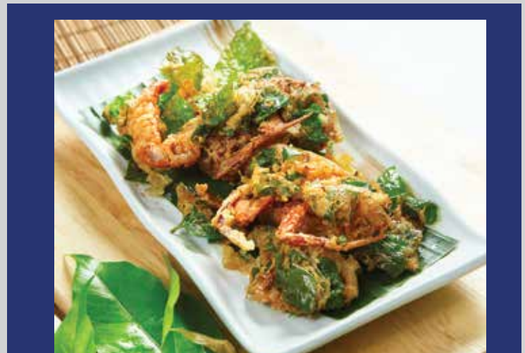
Soft-Shell Crabs Deep-Fried with Baegu Leaves 420.- Soft-shell crabs from Suratthani hand-picked for this menu are battered with three spices, wrapped in baegu leaves – the queen of southern Thai vegetables – and deep-fried in hot oil.

ปลาหมึก/ปูนิ่ม/เนื้อปู/พัดผงกะหรี่ เครื่องแกงผงกะหรี่สูตรพิเศษคลุกเคล้าจากทะเล จนได้รสชาติเข้มข้นหอมฉุย