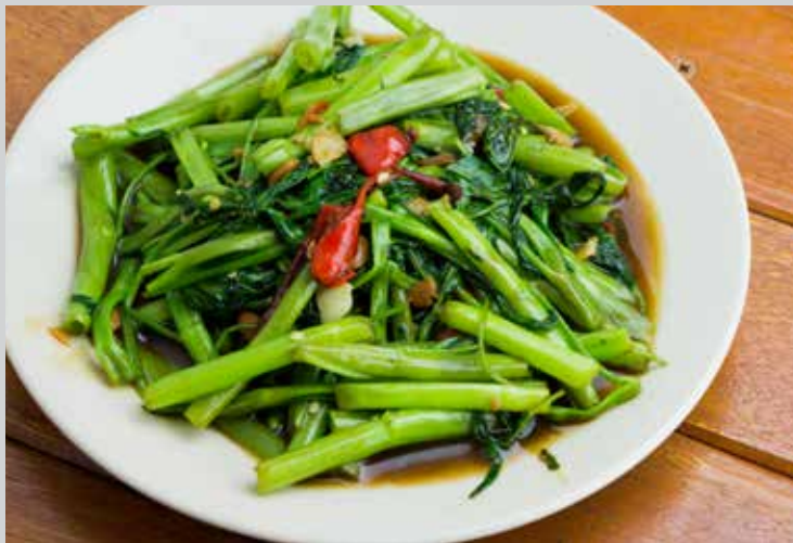
Stir Fried Morning Glory 320.- A world famous stir-fried Thai dish. Morning glory wok stir-fried with oyster sauce and chilli. A must have delicacy.

ผัดผักบุ้งไฟแดง เมนูจานผัดที่โด่งดังไปทั่วโลก ผัดด้วยไฟแรงจนหอม พร้อมเสิร์ฟความอร่อยที่ไม่ควรพลาด