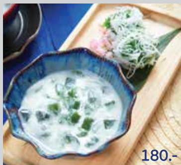
Pandan Sago Dumplings and Pandan Jelly in Coconut Milk