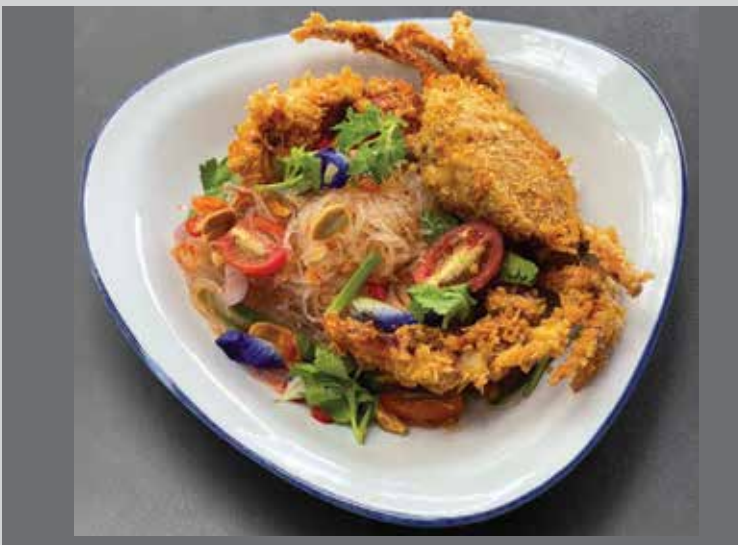
Vermicelli Salad with Deep-Fried Softshell Crabs 360.-/380.- /Seafood

เนื้อวัวสันนอกออสเตเลียหมัก คลุกเคล้าน้ำยำกับผักสดต่างๆ