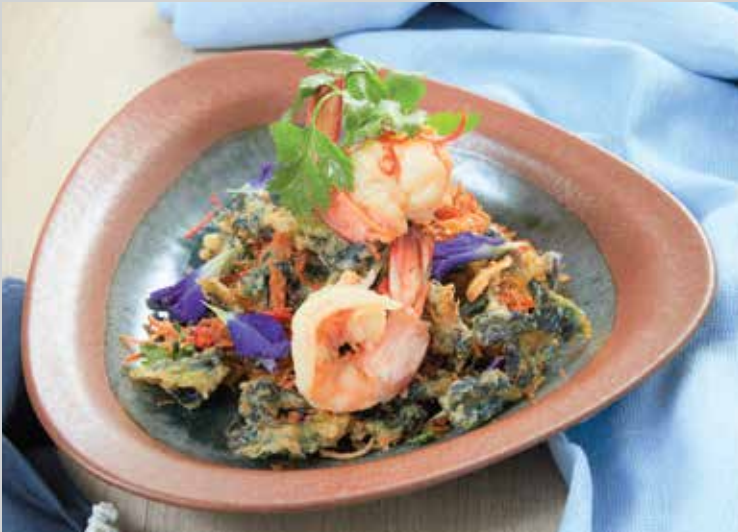
Butterfly Pea Salad with Shredded Pork 260.- Deep-fried butterfly pea and shredded pork are tossed in Thai-style spicy salad dressing and sliced greens.