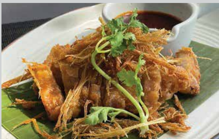
Pork Belly Deep-Fried with Lemongrass 280.- Pork belly gets deep-fried until golden brown, seasoned with authentic oyster fish sauce, topped with finely sliced deep-fried kaffir lime leaves, and served with a tasty seafood dipping sauce.

ปีกไก่ทอดใบมะกรูด เทคนิคการนำไปทอดในน้ำมัน2รอบ ด้วยอุณหภูมิและเวลาที่ต่างกันทำให้ปีกไก่มีความกรอบนานมากขึ้น หอมโดดเด่นด้วยตะไคร้ใบมะกรูดทอดกรอบ รสชาติเค็มกำลังดีทานเคียงกับซอส