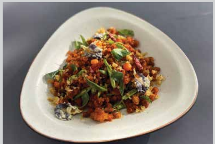
Cabbage Stir-fried with Smoked Shrimps 260.- Another recommended dish to entice everyone's taste buds features fragrant fish sauce, palm sugar and cabbage stir-fried on high heat and complimented with Goong-Siap or smoked shrimps, a local delicacy from Phuket.

Baegu leaves with its slight creamy and sweet taste are stir-fried on high heat with fresh eggs and the crunchiness that is Goong-Siap or smoked shrimps hand-picked ใบเหลียงผัดไข่กุ้งเสียบ ผักเหมียงที่มีรสชาติมันอมหวาน ผัดกับไฟแรง พร้อมคลุกเคล้าไข่สด เพิ่มความกรอบหอมของกุ้งเสียบจากภูเก็ตที่คัดมาอย่างดี