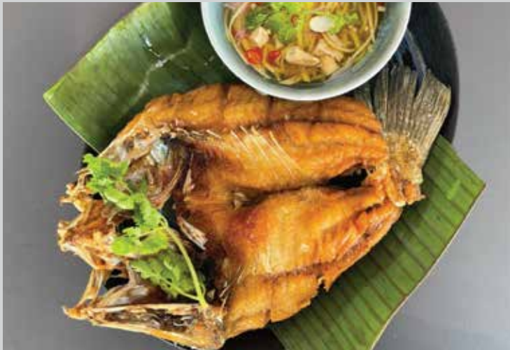
Sea bass Deep-Fried in Fish Sauce 480.- Sea bass is drowned in hot oil until crispy to bite yet tender to chew, then topped with fish sauce at once to rehydrate the fish, served with raw mango salad for an all-flavor experience.

ปลากระพงทอดราดน้ำปลา ทอดปลากระพงทอดน้ำมันท่วมๆ จนกรอบนอกนุ่มใน ราดด้วยน้ำปลาตอนยกออกจากน้ำมันทันทีให้ซึมเข้าไปแทนที่น้ำในเนื้อปลา เสิร์ฟกับ ยำมะม่วงเปรี้ยวมัน