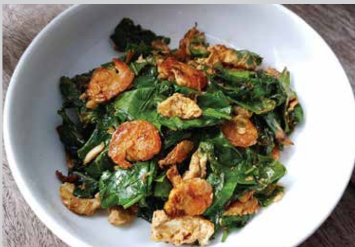
Baegu Leaves Stir-Fried with Smoked Shrimps 280.-

กะหล่ำปลีผัดกุ้งเสียบ เมนูชวนทานอีกหนึ่งเมนูทานได้ทั้งครอบครัวหอมหวานชวนทานด้วยกลิ่นของน้ำปลาปรุงพิเศษ กลมกล่อม โดยน้ำตาลมะพร้าว กะหล่ำปลีที่ผัดไฟแรง พร้อมกับกุ้งเสียบภูเก็ตกับกุ้งเสียบภูเก็ต