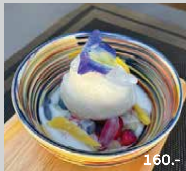
Water Chestnuts in Iced