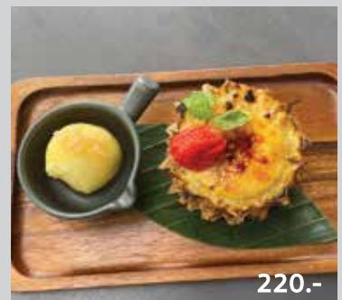
Phuket Pine Apple Creme Brulee