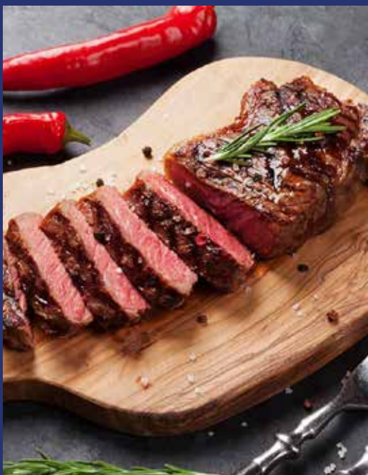
Grilled Strip-loin steak 980.-