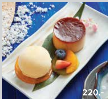
Caramelized Egg Custard with Tangerine Ice Cream