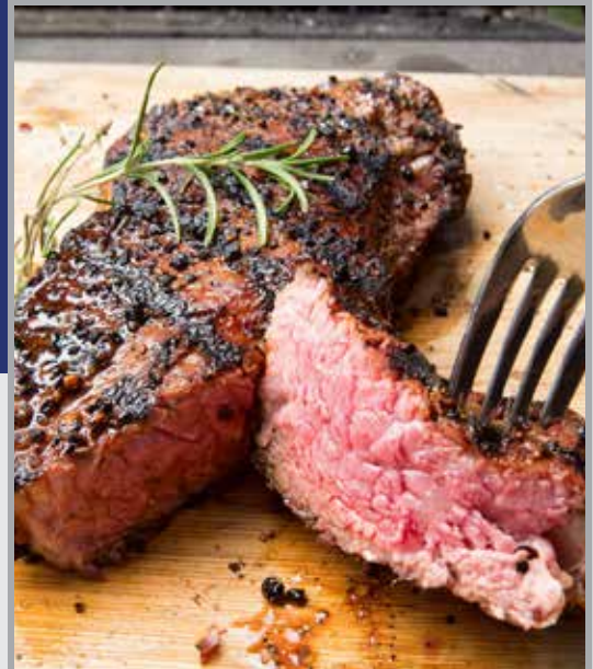
Grilled Australian Beef Rump 520.-

เนื้อวัวออสเตรเลียส่วนสะโพก ปรุงรสด้วยเกลือฮิมาลายัน ย่างกับเตาถ่านไฟแรง เสิร์ฟพร้อมกับผักย่างและซอสแจ่วเข้มข้น