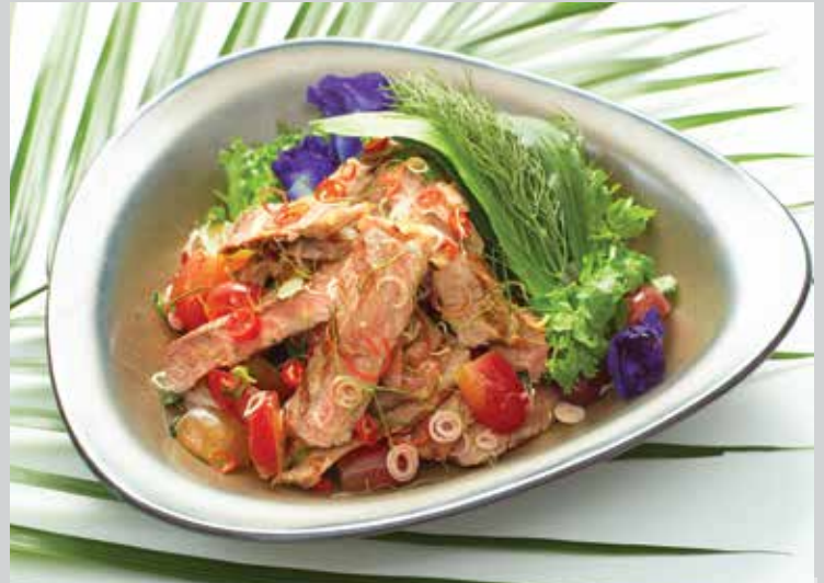
Australian Grilled Beef Salad with Grapes 480.- Grilled Aus. striploin steak and grapes are tossed in Thai-style spicy salad dressing and assorted vegetables.

ดอกอัญชันทอดกรอบพร้อมหมูฝอย คลุกเคล้าพร้อมผักซอยและน้ำยำรสแซ่บ