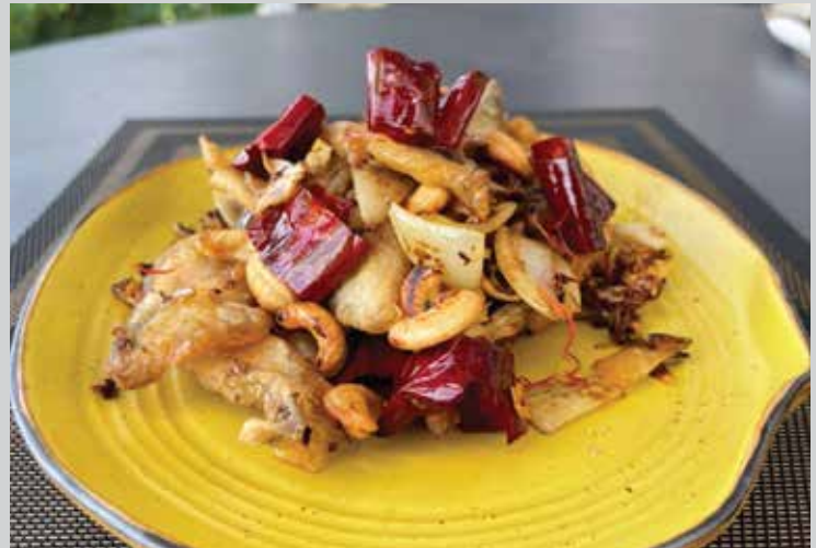
Crispy Fish Stir-fried with Cashew Nuts 360.- This dish boasts its full and well-rounded flavors that are crispy fish, cashew nuts and Bang Chang sun-dried chilis, stir-fried with aromatic Chinese liquor.

ปลากระพงทอดราดน้ำปลา ทอดปลากระพงทอดน้ำมันท่วมๆ จนกรอบนอกนุ่มใน ราดด้วยน้ำปลาตอนยกออกจากน้ำมันทันทีให้ซึมเข้าไปแทนที่น้ำในเนื้อปลา เสิร์ฟกับ ยำมะม่วงเปรี้ยวมัน