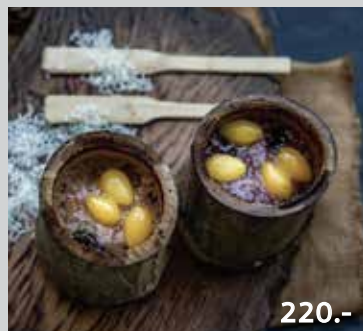
Sticky Rice Cooked with Coconut milk topping with ginkgo