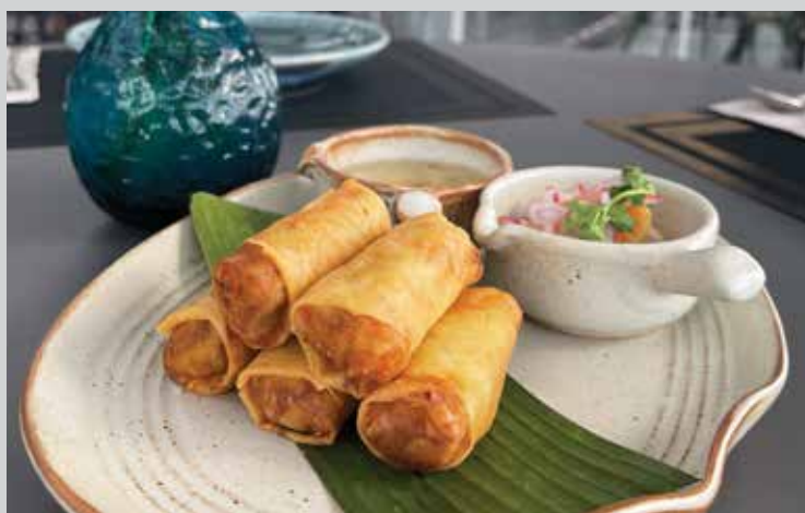
Deep Fried spring roll with plum sauce 240.- White cabbage, carrot, vermicelli, wood ear mushroom and homemade plum sauce

หมูสามชั้นตะไคร้ทอดกรอบ สามชั้นทอดจนเหลืองกรอบ คลุกเคล้าน้ำปลาหอมนางรมแท้ พร้อมใบมะกรูดกรอบซอย เสิร์ฟกับน้ำจิ้มซีฟู้ด