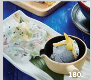
Pastry flour mix with white sesame in coconut