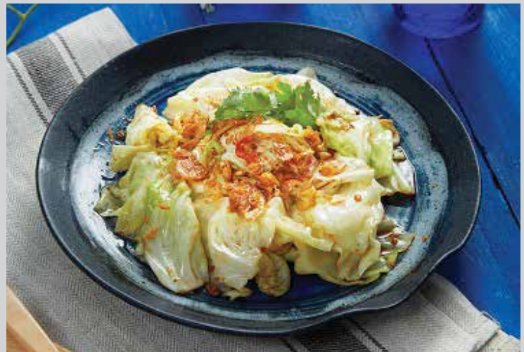
Cabbage Stir-fried with Smoked Shrimps 260.- Another recommended dish to entice everyone's taste buds features fragrant fish sauce, palm sugar and cabbage stir-fried on high heat and complimented with Goong-Siap or smoked shrimps, a local delicacy from Phuket.

ผัดผักบุ้งไฟแดง เมนูจานผัดที่โด่งดังไปทั่วโลก ผัดด้วยไฟแรงจนหอม พร้อมเสิร์ฟความอร่อยที่ไม่ควรพลาด