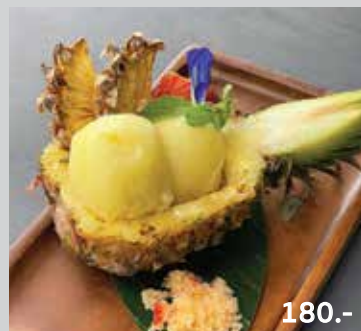
Phuket Pine Apple Sorbet