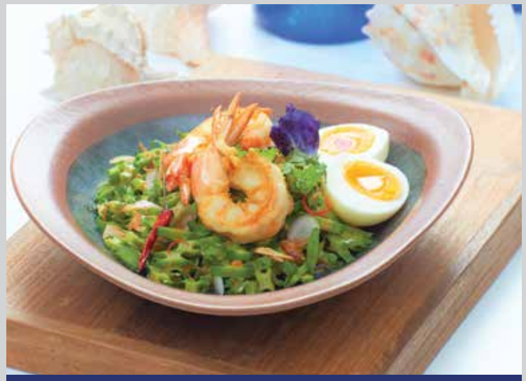
Thai Style Winged beans salad with soft-boiled egg 320.- Poached winged beans, minced pork and shrimp mixed together with Thai style sauce to create flavored dish. Which is best eaten with soft-boiled egg

วุ้นเส้นแบนคัดพิเศษ คลุกด้วยน้ำยำจนได้ที่ พร้อมปูนิ่มทอดกรอบอร่อยลงตัว