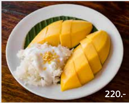
Mango Sticky Rice with Coconut Milk

There is nothing more satisfying than a mouth-watering dessert at the end of an incredible meal. possibly, the only thing that could send you into a different stratosphere is to serve it with a dessert wine that compliments the taste and complexity of the dessert itself.