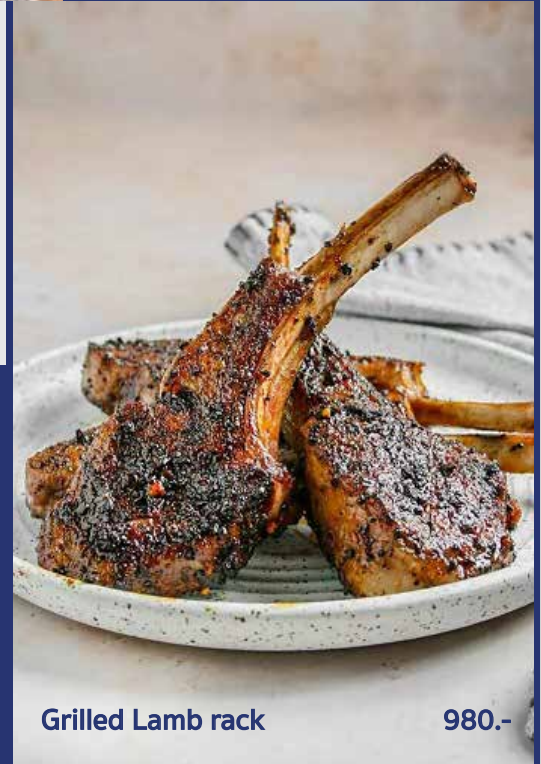
Grilled Lamb rack 980.-

เนื้อแกะออสเตรเลียติดกระดูกปรุงรสด้วยเกลือฮิมาลายัน พริกไทยดำเกล็ด เสิร์ฟพร้อมข้าวเหนียว และซอสแจ่วเข้มข้น