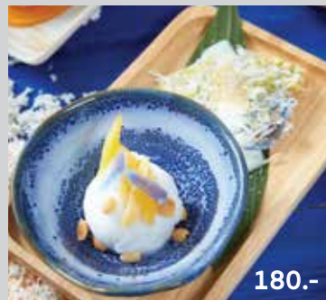
Mung Bean Mochis with Young