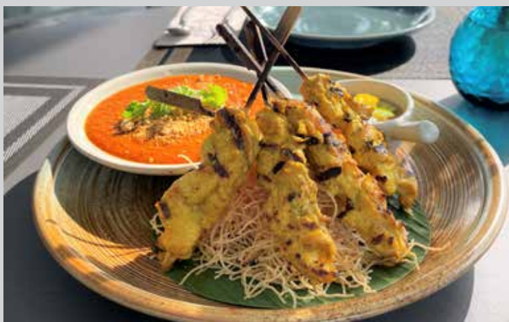
Classic Thai chicken satay (4 sticks) 260.- Perfectly grilled chicken satay skewers in the most flavorful marinade serve with homemade Thai satay sauce.

STARTER & SHARE BON APPETIT palette - boosting appetizers to die for